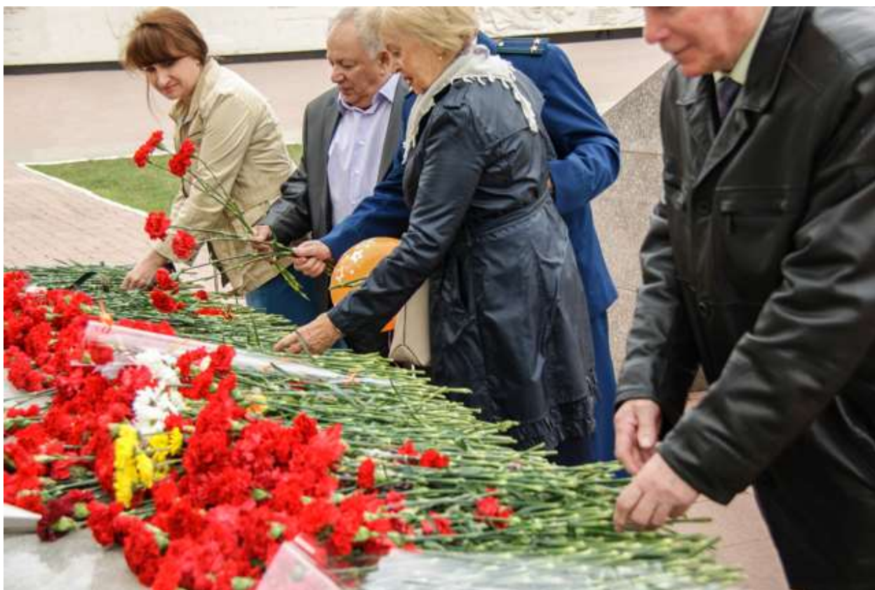
Возложение цветов вместе с ветеранами прокуратуры к памятнику героям на площади Победы города Благовещенска

Коллективы работников и ветеранов прокуратуры области, городов и районов принимают участие в общегородских торжественных мероприятиях, посвященных Дню Победы.