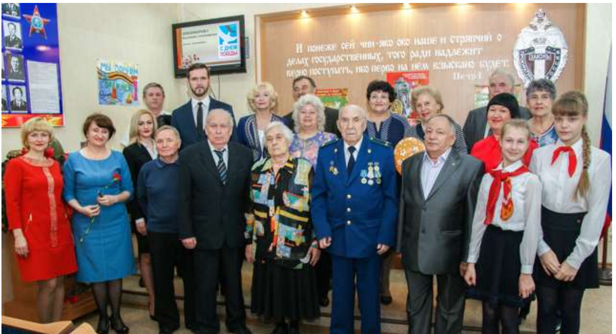
Торжественное собрание в прокуратуре области 5 мая 2017 года, посвященное Дню Победы

Так, в канун Дня Победы в текущем году на концерте звучали песни военных лет в исполнении работников прокуратуры, которые стали лауреатами областного конкурса «Во славу Отечества». Приглашенные на торжество вдовы прокуроров-фронтовиков, их дети, а также пенсионеры прокуратуры области охотно делились своими воспоминаниями о суровых годах войны, воспоминаниями из страшного, голодного детства, суровых испытаниях, которые довелось им пережить. В ходе торжественного мероприятия была зажжена символическая «свеча памяти», объявлена минута молчания в память о прокурорских работниках-фронтовиках и тружениках тыла.